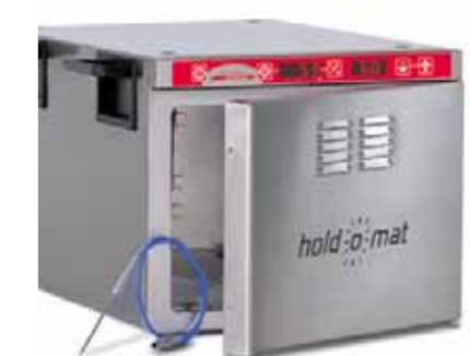
KTM-Föhler nicht im Lieferumfang enthalten

Warmhalte- u. Niedertemperatur-Gargerät Modell: Hold-o-mat € 1.999,- Maße H/L/T: 415 x 675 x 343 mm Anschluss: 230 V / 1,0 kW Gewicht: 24 kg netto Kapazität: 3 x GN 1/1-65 oder 2 x GN 1/1-100 Art.-Nr.: 5590001