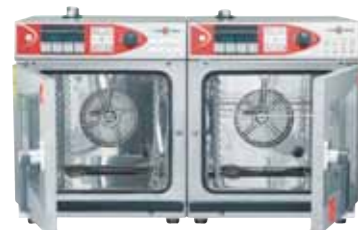
OES 6.06 mini mit CONVOClean system, CONVOVent

* Alle Angaben gelten für Standardversionen ohne easyToUCH und CONVOClean system